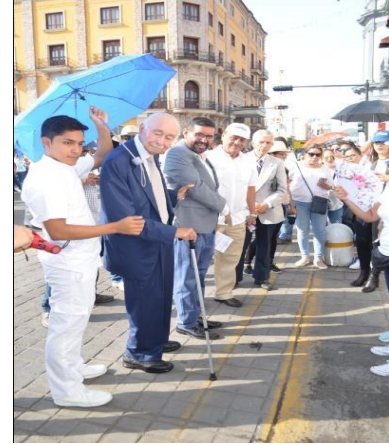
Camino de plata en el 2019