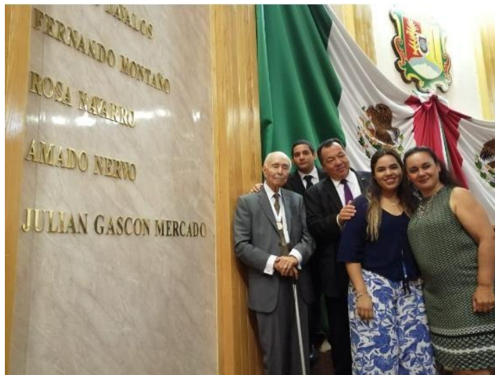
Homenaje en la Cámara de Diputados en Nayarit