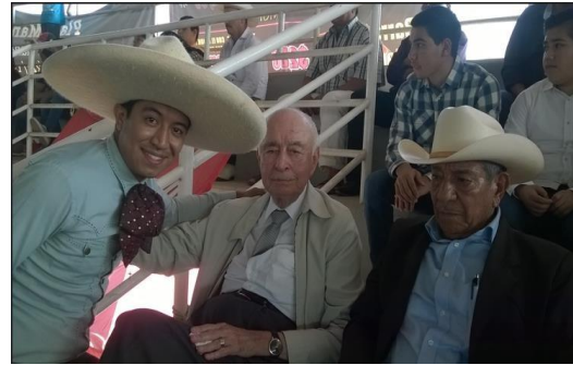
Disfrutando de una charreada en el Lienzo charro el Dorado, San Cayetano, Nay.

Hemos sido partícipes de un sinnúmero de homenajes a su persona, en la que nos invita a acompañarlo, desde en la cámara de Senadores, la cámara de Diputados, la embajada de España en México, y otros más, en una ocasión nos invitaron a escuchar su currículum, fue tan impresionante que para leerlo tardaron 45 minutos y solo dijeron lo más relevante.