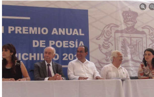
Concurso anual de poesía del Trapichillo