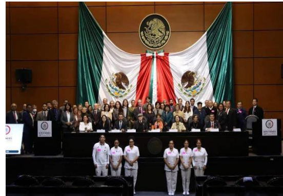
Homenaje en la Cámara de Diputados en la ciudad de México, D. F.