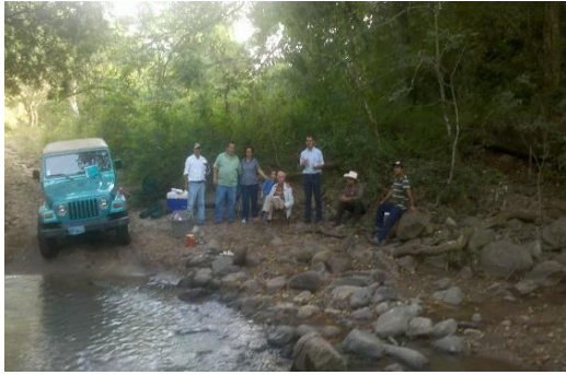
Comiendo en el antiguo camino Real a San Blas