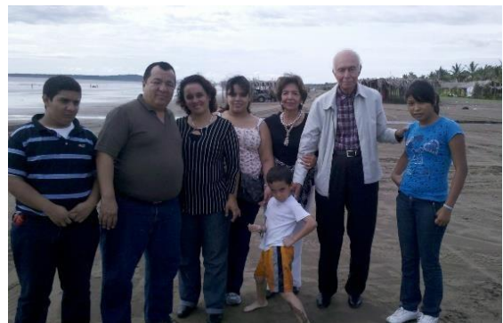
En el puerto de San Blas, Nay