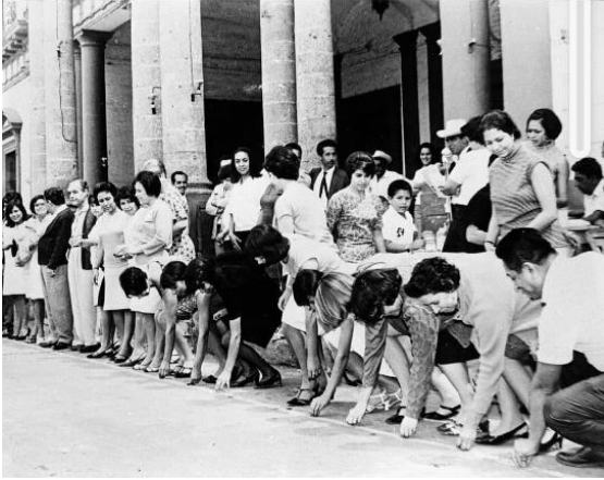
El camino de plata en 1968