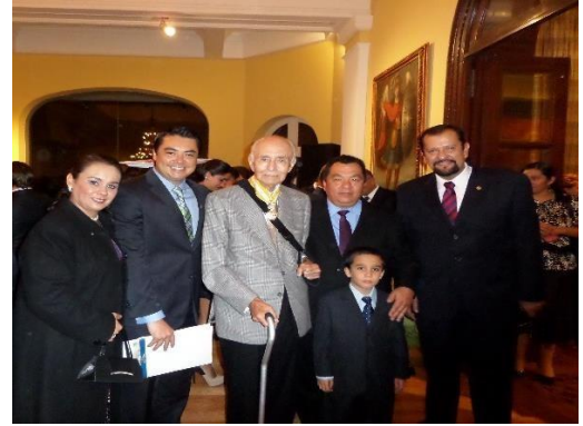
Reconocimiento del Rey de España en embajada Española, cd. De México,DF