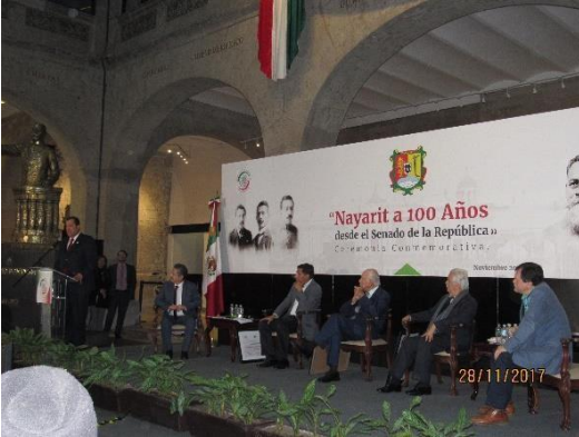
Homenaje a Nayarit por su centenario, en la Cámara de Senadores, cd. De México