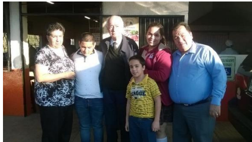
Los nietos de Nayarit